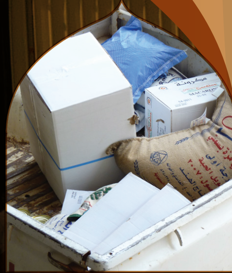
توزيع المواد الغذائية